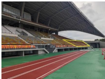
左ベンチ鳴り物エリア