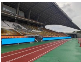
左ベンチ横断幕掲出エリア