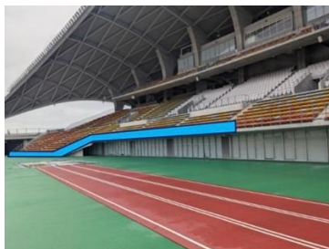
右ベンチ横断幕掲出エリア