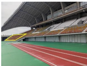
右ベンチ鳴り物エリア